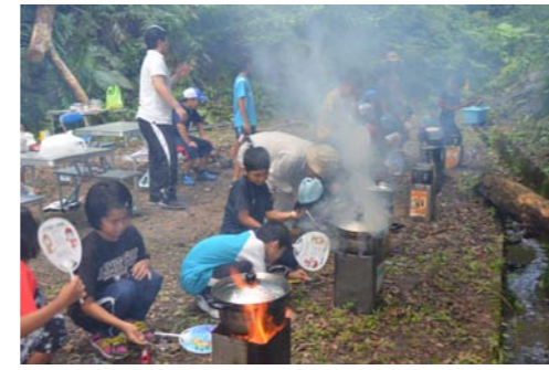
とにかくけむいですが…

④ 夕食も済ませ、あとは肝試しか昆虫採集を楽しむぞ～と思っていたら、雨…雨…雨～!! テントがあるから大丈夫と思いきや、老朽化のせいでどのテントも雨漏り&浸水。キャ～!! 子どもたちの安全も配慮し、無念の下山、改善センターでの宿泊となりました。改善センターでは緊張がほぐれたせいか、修学旅行のようにしゃぐ団員たち。「肝試しがしたい!」というリクエストに応え、怖い話を聞かされたところ、肝試しどころか一人でトイレに行けなくなるくらいのがりよう…。意外にみんなビビリでした(>_<)