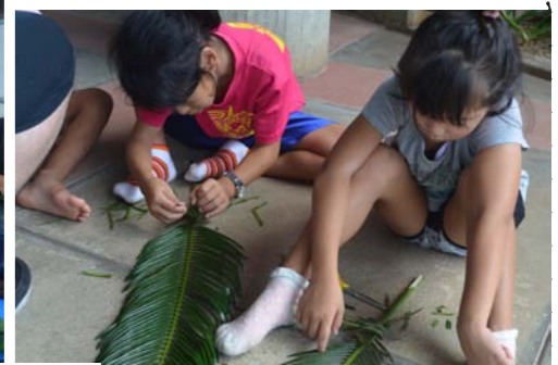
みんな、真剣。もくもくと作業に没頭しています。

③ 午後からは、いよいよキャンプ!! さあ、ここからはガスも電気もない森で1日過ごすことに。もちろん、寝床やトイレも自分たちで作らなきゃならない。現代っ子にはちょっと過酷なキャンプ。テントも張り、燃料となるマキもあつめ、先生の指示に従って火おこし、飯盒炊飯、カレー作りをしました。