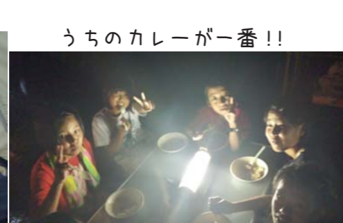
うちのカレーが一番!!