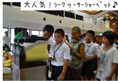
大人気! シークワーサーシャベット♪