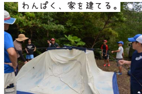
わんぱく、家を建てる。