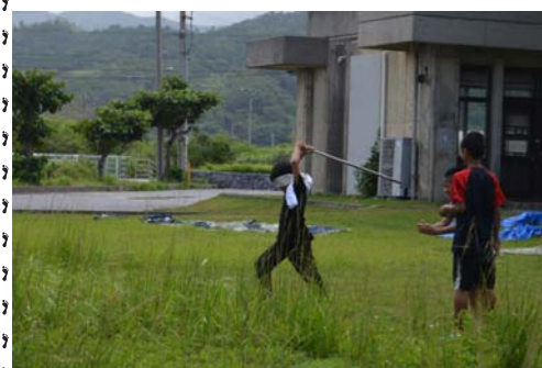
彼は何と戦っているのか…

最後は頑張ったみんなにごほうびタイム♪差し入れのスイカでスイカ割りをしました。ぐるぐる回ったせいか、とんでもない方向に歩いていく団員… と、言うか、そんな方向に誘導していく仲間たち… 盛り上がったところでスイカも割れ、2個あったスイカはあっという間に団員たちのお腹の中へ消えていきました…。