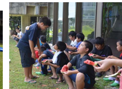
外で食べるスイカは格別だぁ