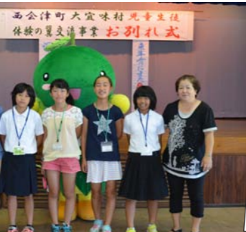
たくさん思い出できました!!