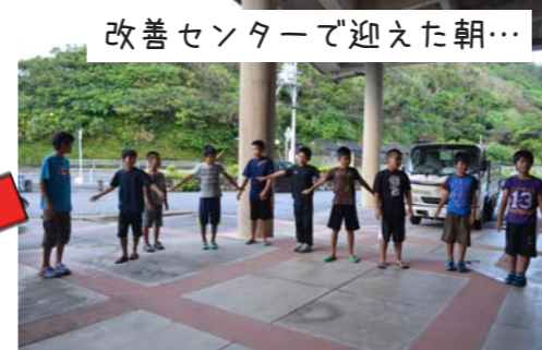
改善センターで迎えた朝…