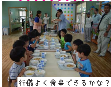
行儀よく食事できるかな?