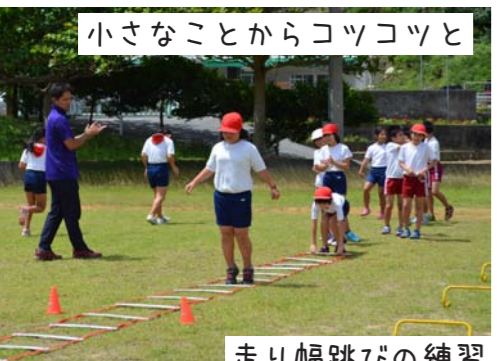
走り幅跳びの練習