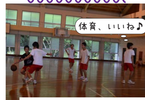
遊んでいる様ですが授業です