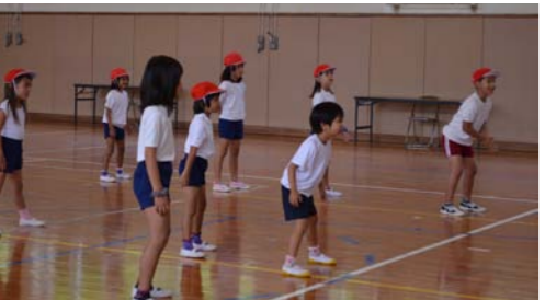
↑低学年、↓高学年 体育