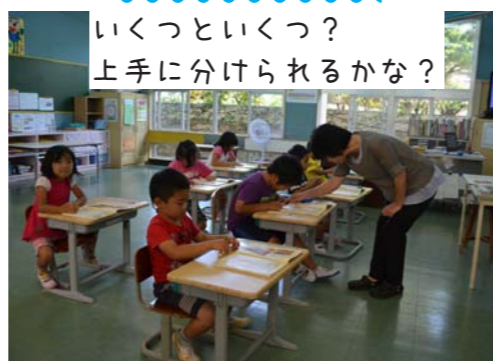
いくつといくつ? 上手に分けられるかな?