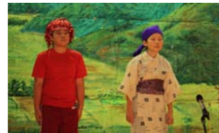
3年生：いろんな世界へとび出そう