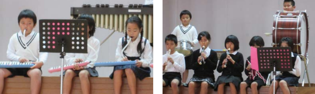
2、3年生：リズムにのって、楽しいえんそう