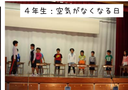
4年生：空気がなくなる日