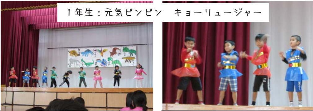
1年生：元気ピンピン キョーリュージャー