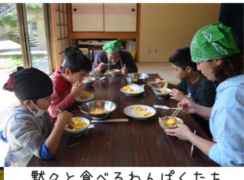
黙々と食べるわんぱくたち

この日は修了式も行われ、全員に修了証が渡されました。また年6回あった講座全てに参加した団員が5名は、皆勤賞も受け取りました。今年度は人数も多く、毎回不安だらけのわんぱくでしたが、1年間の活動を通してできることが増えたり、仲間と協力してできるようになったり、それぞれの団員に成長がみられました。