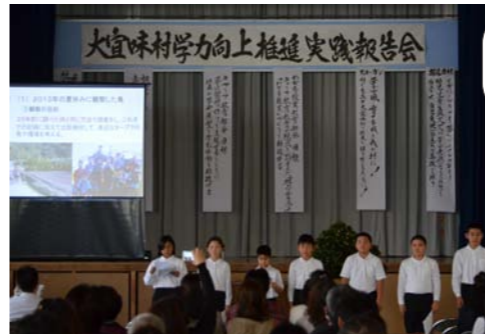
2013年に観察されたターブクの野鳥は?