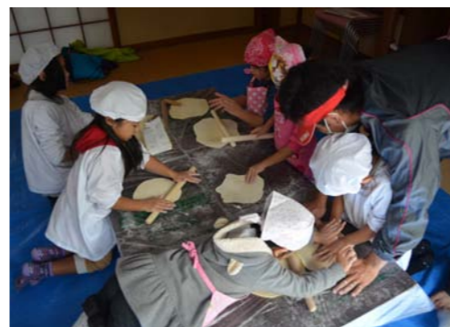
↑生地とともに伸びる少女

「麺はコシが命!」ということで、とにかくよくこね、しばらく寝かせたら、生地をのびして切ります。太さも長さも厚さも違う個性的な麺が続々とできあがりました。