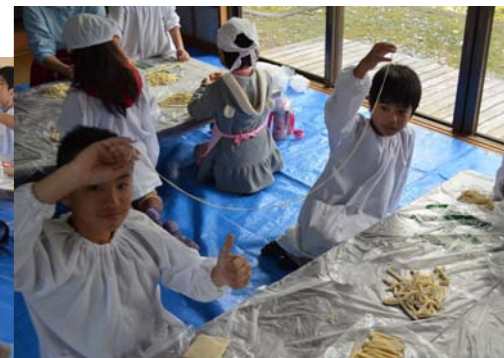
長〜い麺、すすめるのか!?

切った麺はお湯でさっと茹で、そばだしをかけます。卵焼きやかまぼこなどをトッピングしたらわんぱくオリジナル沖縄そばの完成です!!