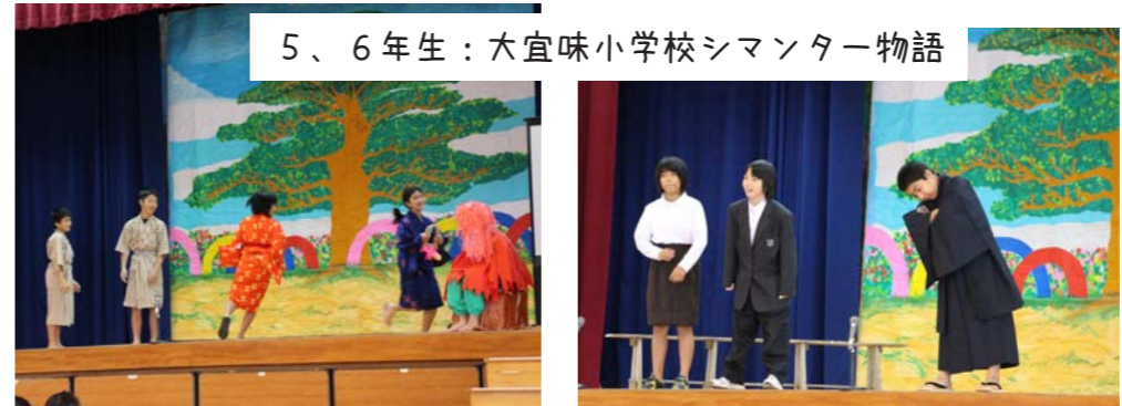
5、6年生：大宜味小学校シマントー物語