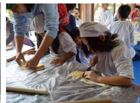
慎重に切っています