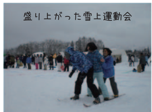
盛り上がった雪上運動会

西会津町最終日には雪国まつりに参加。西会津のメンバーと混合チームで雪上運動会に出場、惜しくも優勝は逃しましたが最高の思い出を作ることができました。