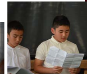
自主的に調査を始めた早朝ターブク追っかけ隊