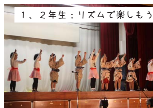
1、2年生：リズムで楽しもう