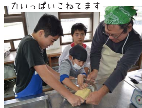
力いっぱいこねてます

ともあれ、少人数ながらも元気いっぱいわんぱくたち。説明もしっかり聞き、順調な滑り出しとなりました。調理実習になると、道具の使い方や作業の進め方などから日頃、家で手伝いをしているかが見えてきます。今回は手伝いをよくしているメンバーが多く、作業は手際よく進められていきました。