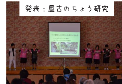
発表：屋古のちょう研究