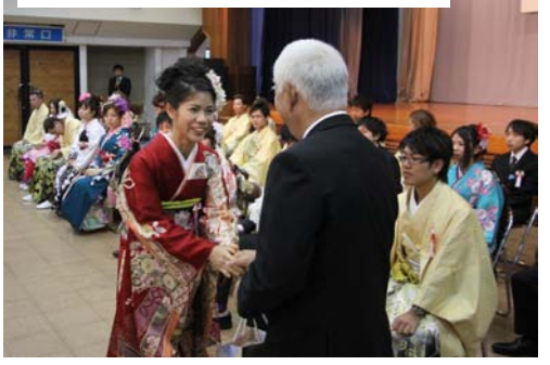
村長から直々に記念品贈呈