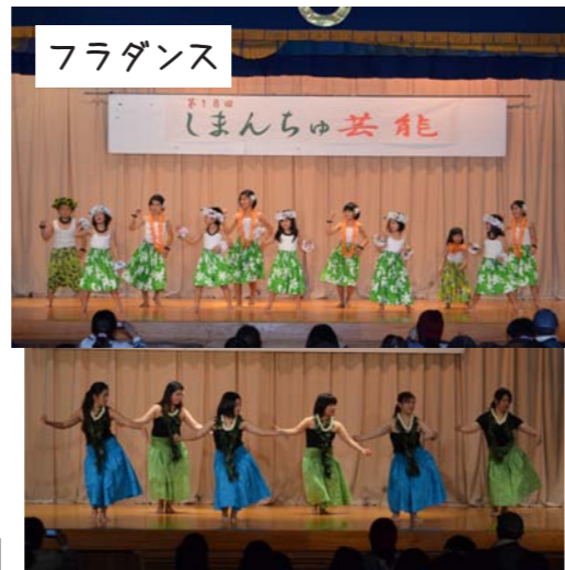
フラダンス 屋古フラガールズ