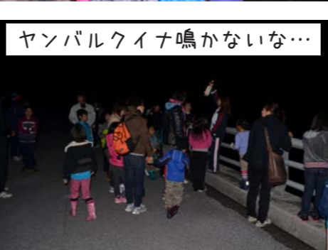
ヤンバルクイナ鳴かないな…