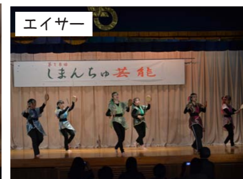
エイサー ネクマチ子会