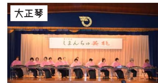
大正琴 琴修会沖縄北支部