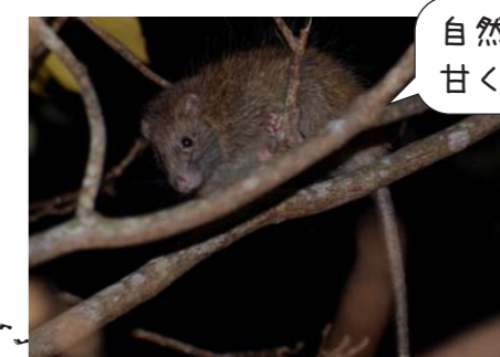
自然はそんなに甘くない