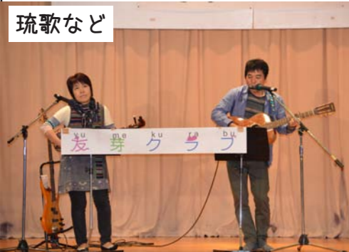
琉歌など 友芽クラブ (ゆめ)