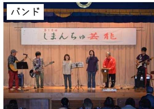
バンド デイサービスおおぎみバンド