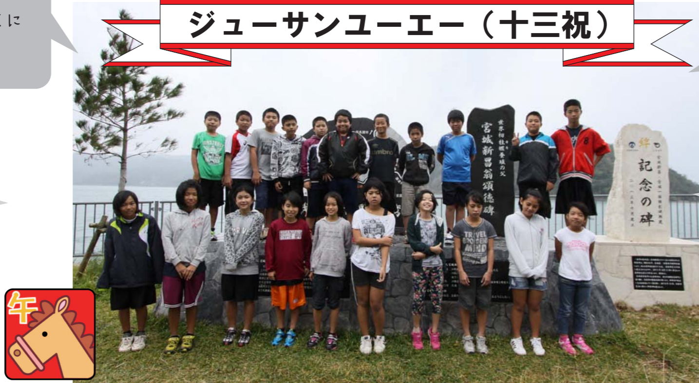
沖縄では、12年ごとに巡ってくる生まれた干支の年が厄年とされ、火の神（ヒヌカン）や仏壇に安全祈願し、来客者の祝いの心で厄を落とすために生年祝い（トウシビー）を行います。今年、初めてのトウシビーを迎える村内の小学生22名に今年の抱負と将来の夢を聞いてみました。