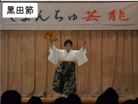
黒田節 西川楚多華道場