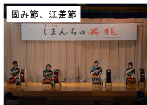
固み節、江差節 乾流太鼓段の会