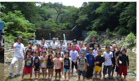
2日目は川で汗と潮とストレス(!?)を流しました!