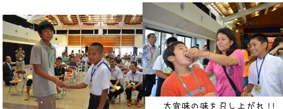
大宜味の味を召し上がれ!!