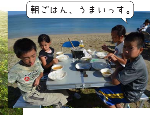
朝ごはん、うまいっす。