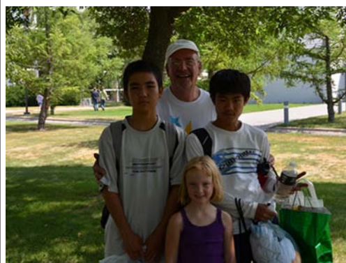
ホームステイ先の家族と

短期留学を終え、3名とも「より英語が好きになった。」「もっと勉強して英語を流暢に話せるようになりたい。」「また、アメリカに行きたい。」と感想を述べました。この経験を今後の生活に活かしてくれることを期待しています。