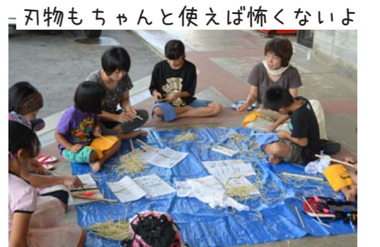
刃物もちゃんと使えば怖くないよ

8月4日（土）、村農村環境改善センターにおいてわんぱく体験団第3弾「あじな一品、手づくり食器」を開催し、キャンプに向けた準備として竹を使って箸やスプーン、コップを作りました。初めて小刀を使う子どもたちも多く、刃物の使い方から教わり、もくもくと作業にとりかかる団員たち。いつもとは違って静かなわんぱくとなりました（いつもよりほね）。慣れない刃物でけが人が続出しましたが（リバテープが足りなくなる事態に...）、大きなケガもなく、思い思いの作品ができあがりました。