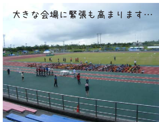
大きな会場に緊張も高まります…