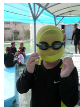
時にはふざけたり…