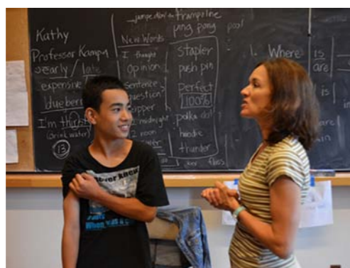
徐々に授業にも慣れてきました