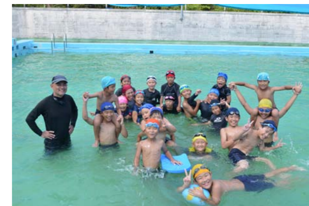
みんな大満足♪ 笑顔で終了～!!