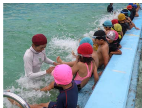
基本のバタ足を覚えます!!

今年も台風の影響を受け、4日間の教室となりましたが、参加した子どもたちは楽しみながら、水に触れ、頭まで水につかるのがやっとだった子が、数メートル泳げるようになるなど最終日の記録会では目標達成者が続出しました。