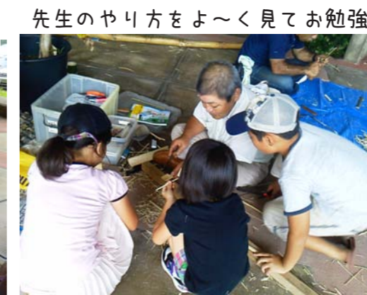
先生のやり方をよ〜く見てお勉強