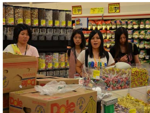
スケールのでかさにはビックリ!