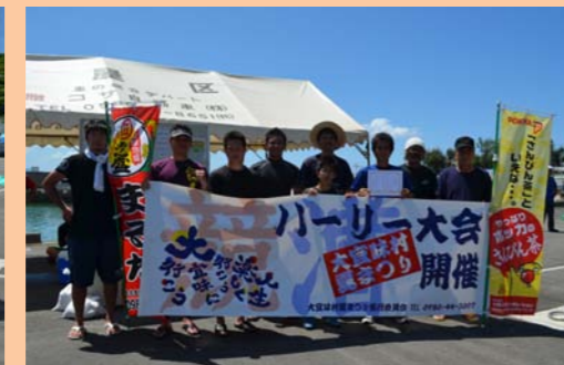
2位と僅差での勝利!!