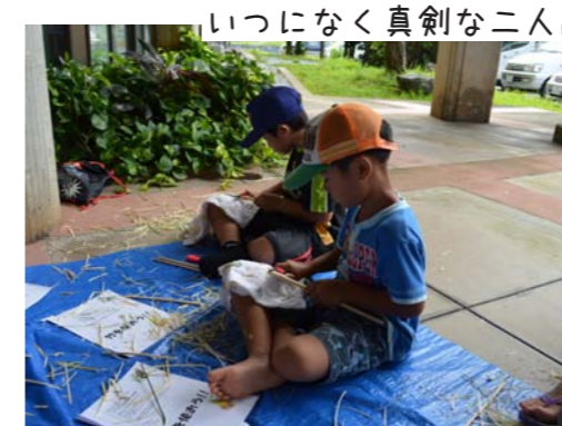
いつになく真剣な二人