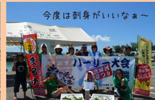
今度は刺身がいいなあ〜