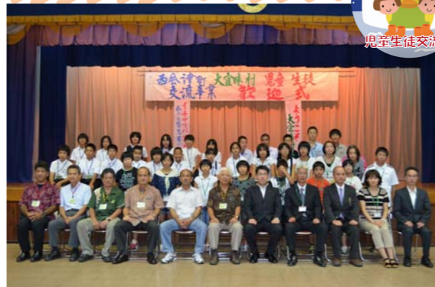
2月にまた会おうね♪

歓迎式では、緊張気味の子どもたちでしたが、2泊3日のホームステイで観光地に行ったり、ビーチパーティーをしたり、エイサーやウミガメ(子ガメ)の脱出(海に帰っていく様子)を見たり、福島の友達と一緒に様々な体験をしたことで、すっかり打ち解け、お別れ式では涙ぐむ子どもたちの姿も見られました。