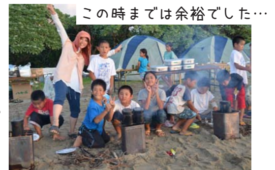
この時までは余裕でした...

今年はこれまでとは違って海でのキャンプ。午前中に釣りをし、午後からキャンプ地へ。予想以上に暑く、子どもも大人も体力が奪われ、作業もゆっくりになってしまい、遅い夕食をとることとなりました（陽も火も暑（熱）かったからね〜）。予定通りにいかない部分も多々ありましたが、初めてキャンプをした子、初めてマキに火をつけてご飯を炊いた子、初めてご飯の準備をした子など、1泊2日の短い期間でたくさんの初めてが体験でき、1つでも「自分の力でできた」という自信が持てたキャンプになったのではないのでしょうか。