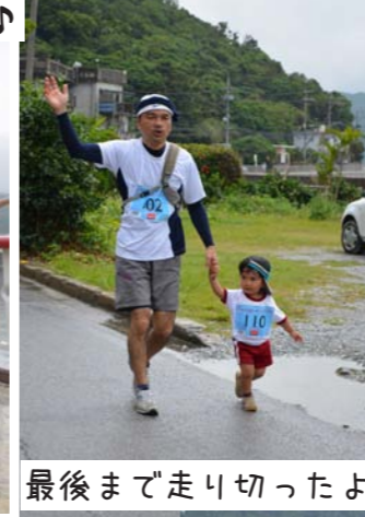
最後まで走り切ったよ。