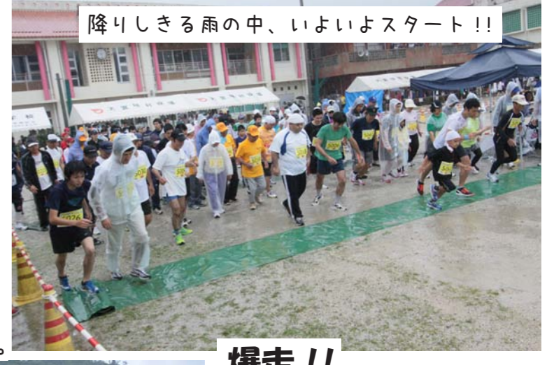
降りしきる雨の中、いよいよスタート！！