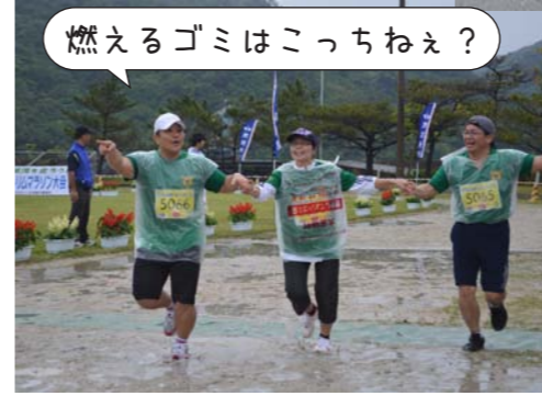
燃えるゴミはこっちねえ？