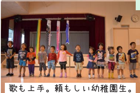
歌も上手。頼もしい幼稚園生。