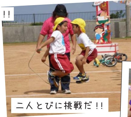
二人とびに挑戦だ!!