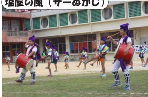
塩屋の風（サーカス）