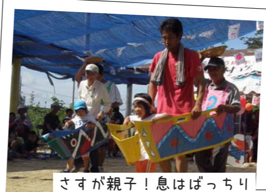
さすが親子！息はばっちり

9月22日（金）、喜如嘉保育所にてぶながや運動会ごっこが開催されました。子どもたちはダンスやわらべうた遊び、ふれあい遊び、体操、バトンリレーなどさまざまな遊びや競技にチャレンジ。平日夕方の開催だったにも関わらず、会場には家族や地域の方々など多くの観客が集まり、ぶながやっ子たちは成長ぶりを見届けました。