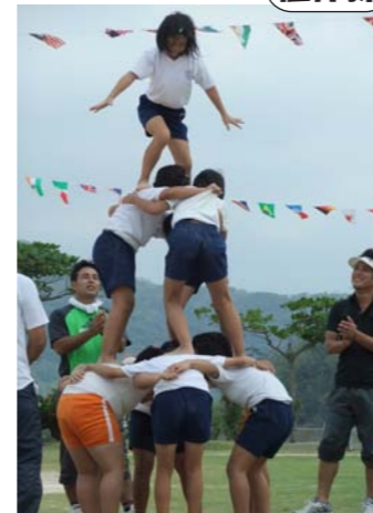
塩屋スカイツリー!?の完成！！