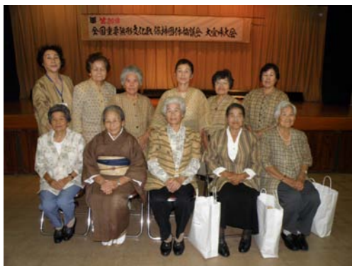
芭蕉布保存会の皆さん