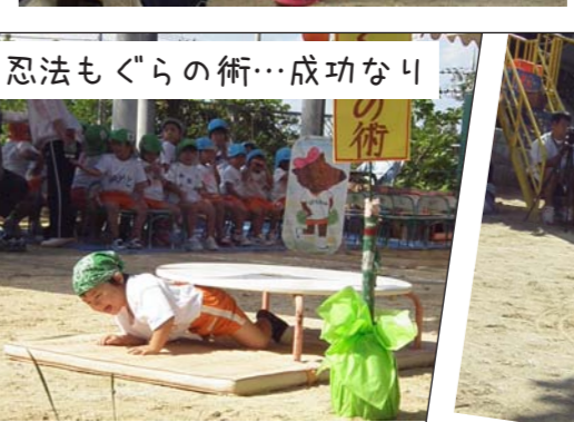
忍法もぐらの術…成功なり