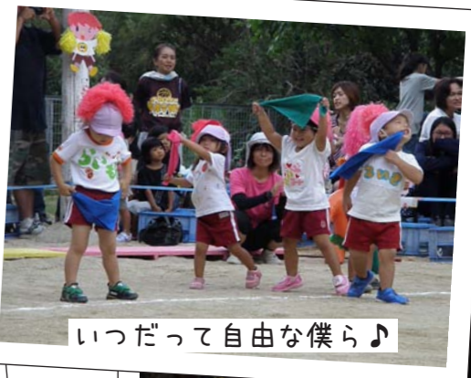
いつだって自由な僕ら♪