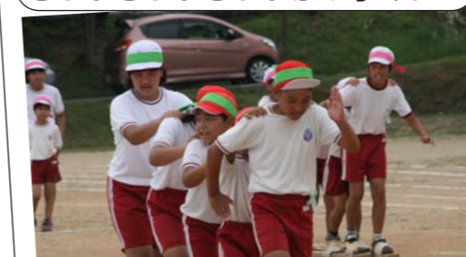
5人の息を合わせてイッチニ、イッチニ