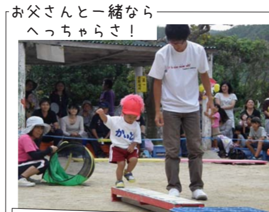
お父さんと一緒ならへっちゃらさ！