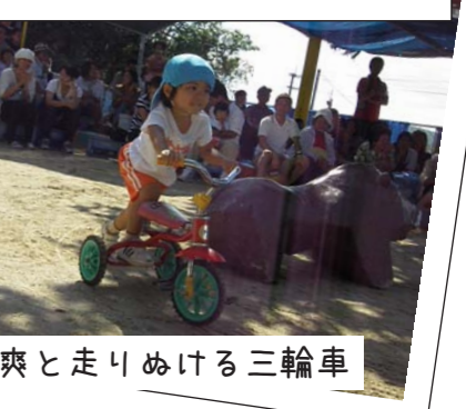
颯爽と走りぬける三輪車

10月22日（土）、塩屋保育所にてヤマシッ子運動会が開催されました。ちゅーりっぷ組のかけっこ&親子ゲームでは変身していつもとは違うお母さんに泣き出す子もいたり、三代リレーでは塩屋ならではのハーリー競争に親子三代で奮闘したり、笑いあり、涙ありで大盛りあがりの運動会となりました。