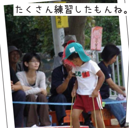
たくさん練習したもんね。