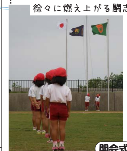
徐々に燃え上がる闘志