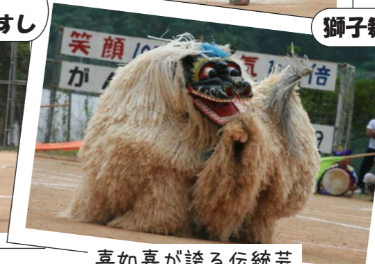
喜如嘉が誇る伝統芸