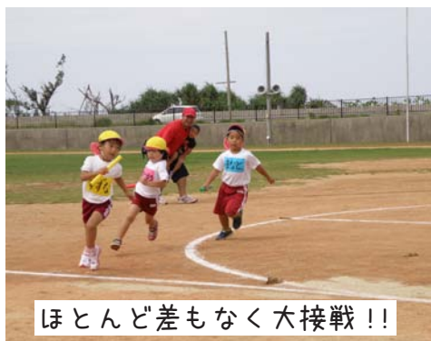
ほとんど差もなく大接戦!!