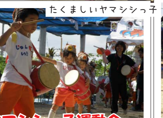
たくましいヤマシッ子