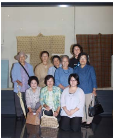
直々に手ほどきを受けます

16日に博物館で行われたワークショップでは、秀作展見学のため博物館を訪れていた芭蕉布保存会のみなさんから直々に糸つむぎを手ほどきをしてもらえ、参加者の皆さんたちはとても喜んでいました。