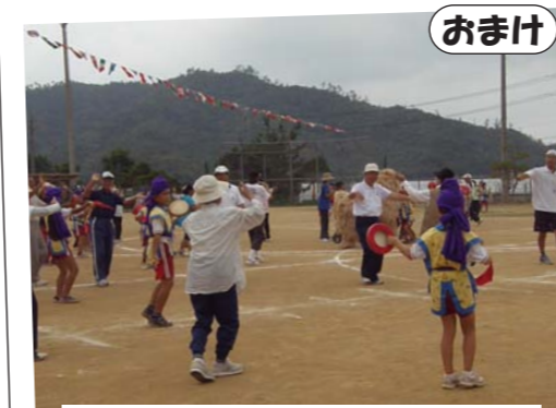
最後はみんなでカチャーシー