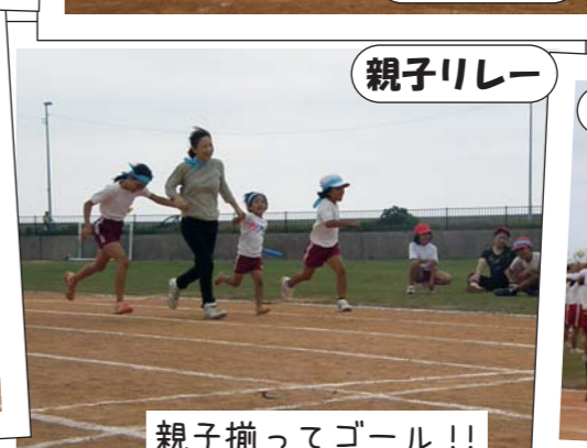
親子揃ってゴール!!