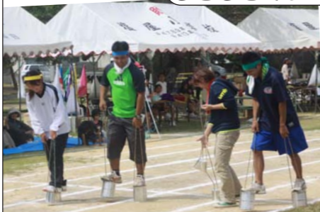
ス々（すぎる?）の 缶ポックリ苦戦中