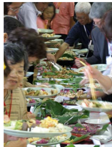
大宜味の味を紹介

翌日は村内の文化財である芭蕉布会館、大山墓、喜如嘉の板敷、旧大宜味村役場、田港御獄の植物群落を視察。参加者たちはカメラ片手に説明を聞き、大宜味村の文化財について学びました。