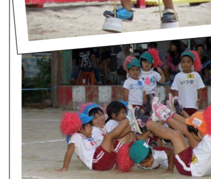
楽しいトンネルくぐり