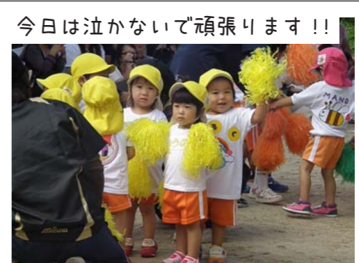
今日は泣かないで頑張ります!!