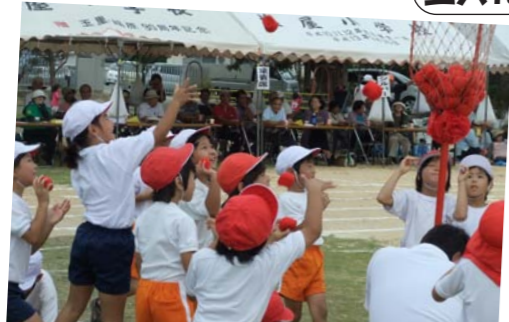
おじいちゃん、おばあちゃんに負けるな！！