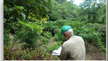
利用状況調査をする農業委員

調査の結果、遊休農地に認定されると農地所有者に対し「利用意向調査」を実施して農地の利用意向を確認します。その確認した意向を踏まえ、農地中間管理機構や円滑化団体への貸付などによる農地のあっせん等を行って農地の利用調整と有効利用を進めます。