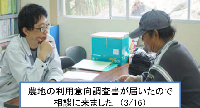
農地の利用意向調査書が届いたので 相談に来ました (3/16)