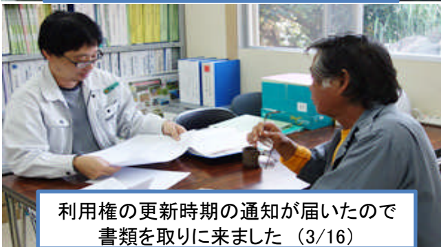
利用権の更新時期の通知が届いたので 書類を取りに来ました (3/16)