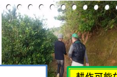
耕作可能な農地が 調査しました!