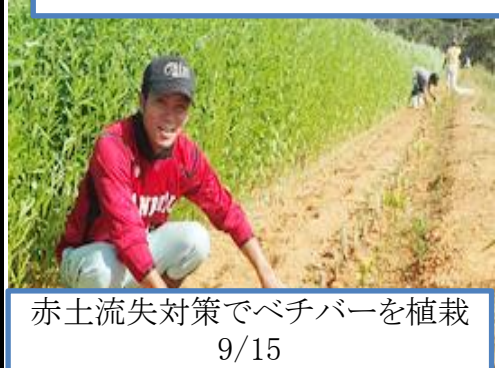
赤土流失対策でベチバーを植栽 9/15