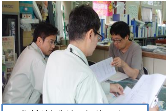
住係長と農地の相談 9/10