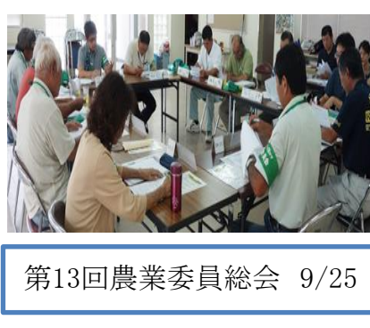
第13回農業委員総会 9/25