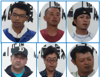
青年就農給付金受給者