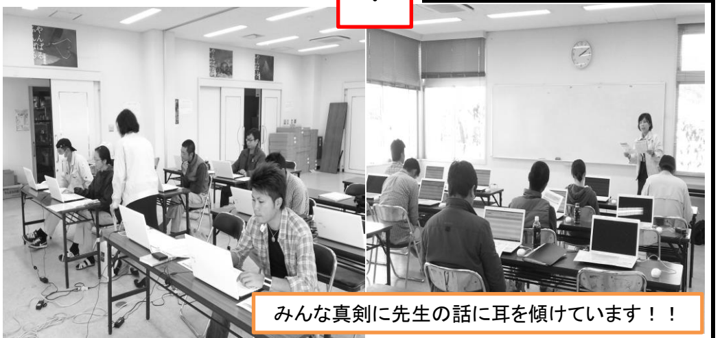
みんな真剣に先生の話に耳を傾けています！！

大宜味村担い手育成総合支援協議会主催による簿記講習会が、12月4日(水)、JAおきなわ国頭支店において開催されました。今回は予算などの関係上、国頭支店での開催となり、新規青年給付金を支給している青年農業者を対象として呼び掛けを行い受講しました。講師は、JAおきなわ農家経営支援センターの職員に担当していただきました。