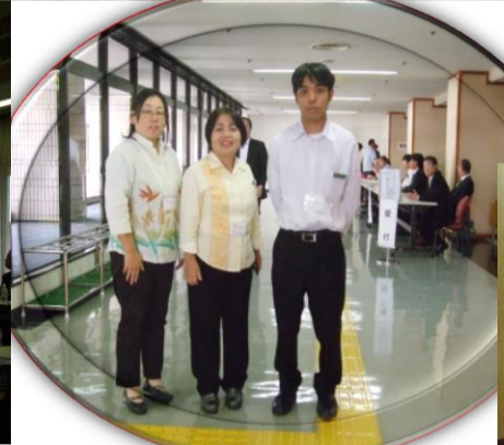
兵庫県立の高校生、民泊受け入れ先100名 (H25.10.25(金)体験)