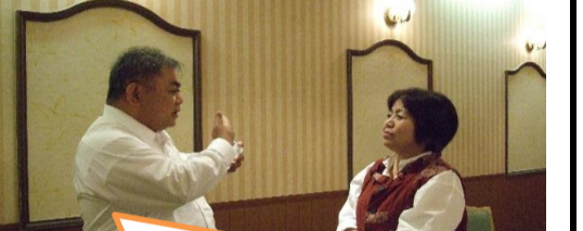
竹富町職員と耕作放棄地解消に向けての情報交換をしました。