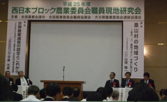
大分県別府市農業委員会のメンバーとの意見交換会