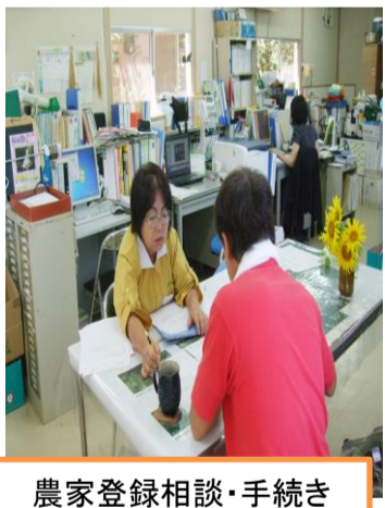
農家登録相談・手続き

◆この場合には、基盤整備法による契約を結ぶことが必要です。5年間で10年間の契約を取り交わします。農地台帳へ耕作農地として登録します。 手続きは、それほど難しくありません。担当地区の農業委員から記入方法などを相談し手続きを進めて下さい。