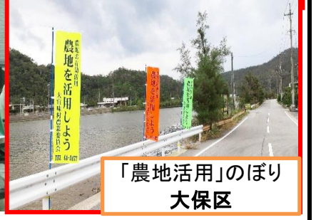
「農地活用」のぼり 大保区