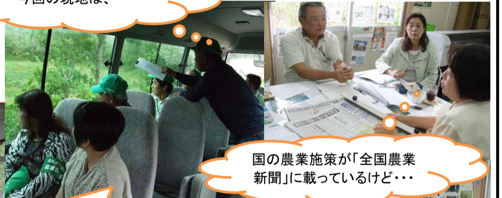
国の農業施策が「全国農業新聞」に載っているけど……

今年、塩屋大豆同好会の3名の方が植えた大豆が、2種合わせて5.5k収穫できました。