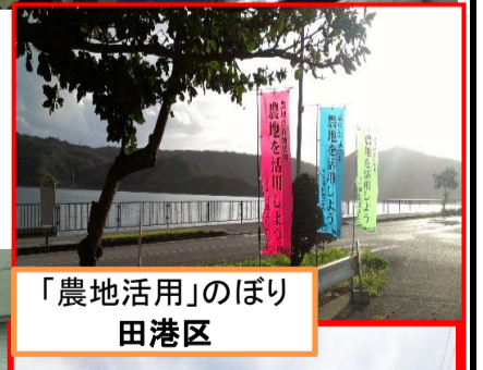
「農地活用」のぼり 田港区