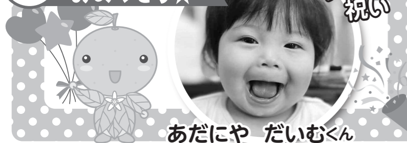
あだにや だいむくん