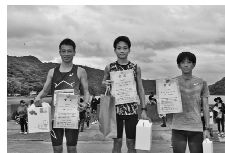
9kmコース男子上位入賞者

4月19日(日)、「第48回塩屋湾一周マラソン大会」(主催:同実行委員会、共催:琉球新報社)が、塩屋湾一帯にて開催されました。各給水所や沿道からの声援に後押しされ、塩屋湾を横目に自分のペースでゆっくり走る参加者や、記録を残そうと全力を尽くして走る参加者など、3コース合わせて合計778名が塩屋湾沿いを駆け抜けました。また今大会は778名の出走者に対し、完走人数は775名で、完走率は99.6%となりました。