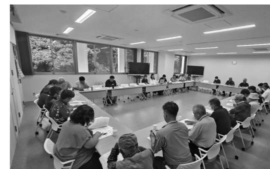
大宜味村産シーワーカー果実を取り扱う県内メーカーの取扱量調査(協議会調べ)

諸々の課題を確認し、その解決と取組実践を見える化するため、協議会「マンダラート」(9マスの表を使って目標やアイデアを整理・目標達成のための思考法)を地農指からの提案指導を受け、シーワーカー振興の強化について確認されました。会の終わりに、会長(村長)から「シーワーカーは大宜味村の主幹作物であり、持続可能なシーワーカー振興となるようぜひとも村ぐるみ、また、事業者、関係機関が一つになって推進していきましょう。」と述べました。