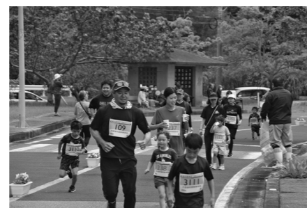
給水をしてラストスパート