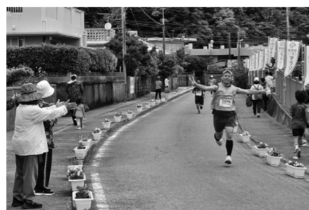
声援を受け、最後の踏ん張り