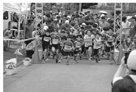
子どもたちも元気にスタート