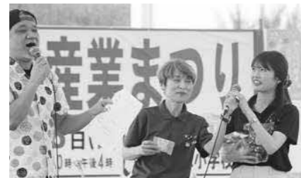
▲ブースのPRをする蟹江町スタッフ