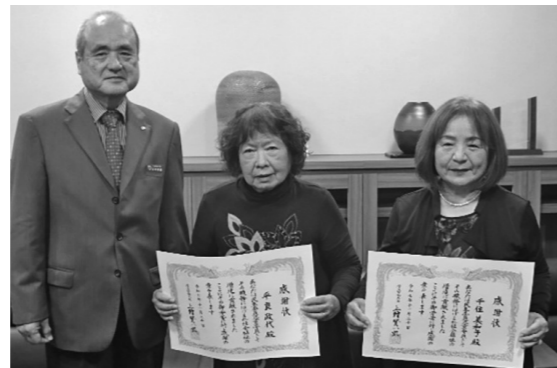
▲友寄村長より厚生労働大臣からの感謝状(6年以上在職者)交付が行われました。