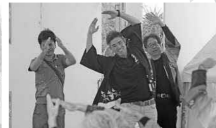
▲西会津「さすけねえわ音頭」