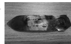
▲20cm程の大きさのアルミ材

近頃、大宜味浄化センター(下水道浄化施設)に食用油やアルミ材などの異物が流れ込み、施設内の圧送用ポンプが詰まって急停止する事例が多発しています。家庭での異物を流してしまうと、ポンプの故障や下水道管の閉塞の原因となり、汚水が流れず下水道利用者の排水設備への逆流など、下水道の使用に支障が出る場合があります。