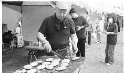
▲石巻市のカキとホタテは大人気