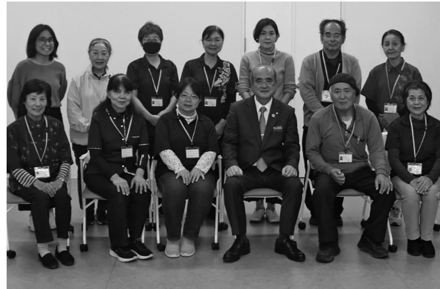
▲村長より厚生労働大臣からの委嘱状交付が行われました。

令和7年12月に一斉改選が行われ、次の皆さまが厚生労働大臣から委嘱されました。任期は3年(令和7年12月1日から令和10年11月30日まで)となっています。