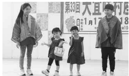
▲村内事業者が制作した衣服でファッションショー