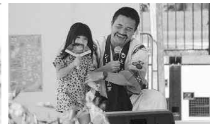
▲じゃんけん大会も大盛り上がり

1月17日(土)、18日(日)に旧大宜味小学校グラウンド及び体育館にて第33回大宜味村産業まつり(主催:大宜味村産業まつり実行委員会)が開催されました。会場には多くのテナントが出店し、大宜味村の特産品や数多くの料理が販売され、来場者を楽しませていました。また、村と交流のある福島県西会津町、宮城県石巻市、愛知県蟹江町からも飲食・PRブースが出店され、それぞれの特産品を販売し行列ができるほど人気を集めていました。