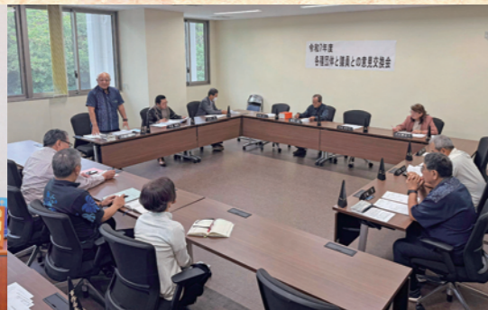
各種団体と議員との意見交換会