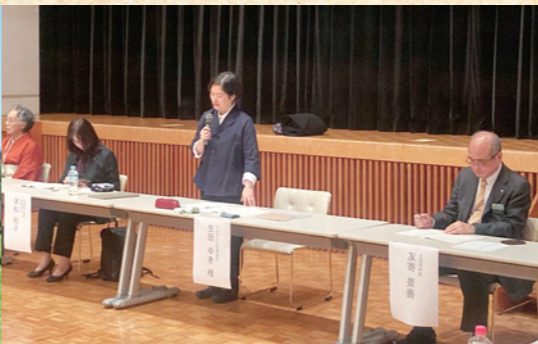
全重協南魚沼・小千谷大会に参加