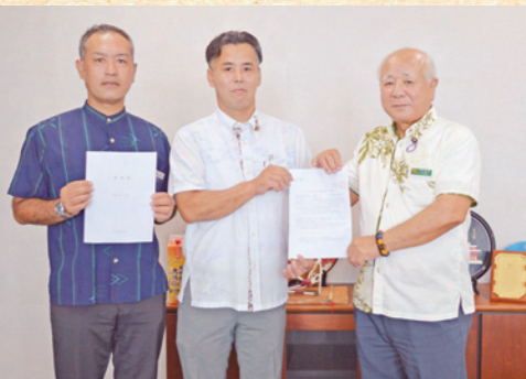
要請対応(村商工会から)