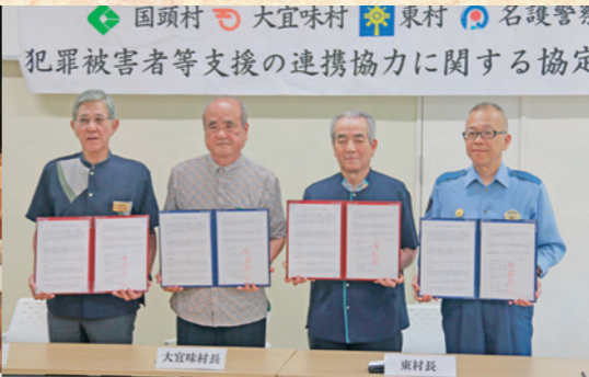
犯罪被害者等支援の連携協力に関する協定締結式