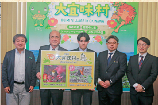
ホントウアカヒゲ村の鳥に制定