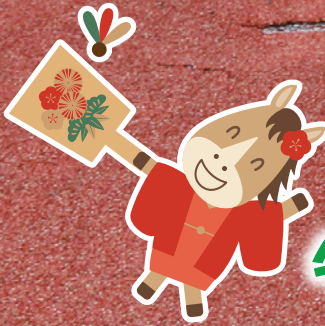
午年生まれの小学生