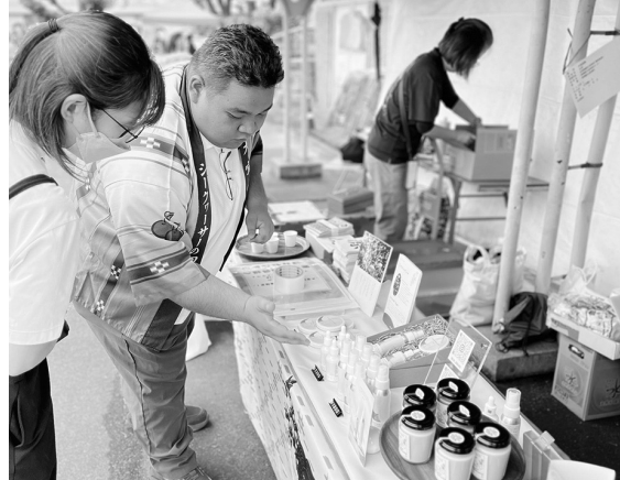
▲かにえ町民まつりへの出店の様子