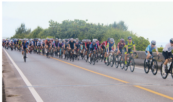
▲一分一秒を争うレース部門は圧巻です!