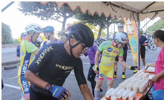
▲休憩をとるサイクリング参加者