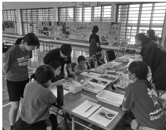
▲土絵の具お絵描き講座