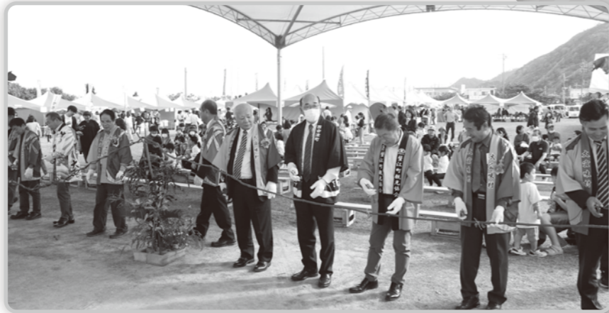
▲オープニングセレモニー テープカット式