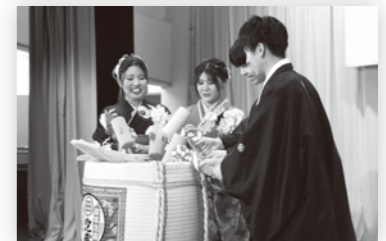
▲激励交流会での鏡割り