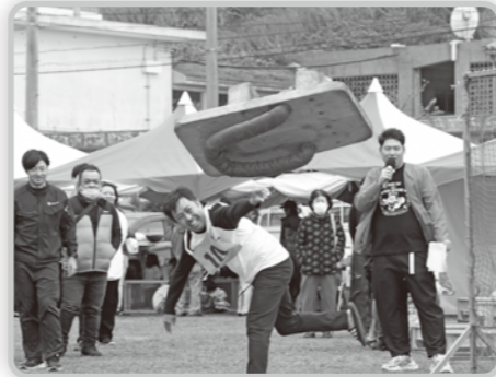
▲西会津町伝統の桐げた投げ大会