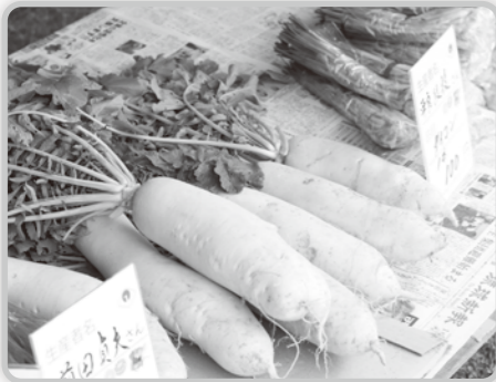
▲立派に育った農作物