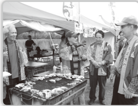
▲石巻市の「牡蠣」と「ホタテ」の販売