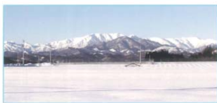
大地を潤す飯豊連峰