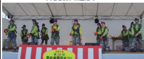
2016 第26回 西会津雪国まつり