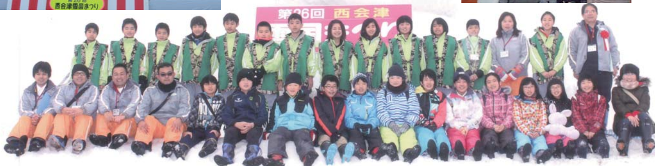
平成27年度・大宜味村「西会津町」体験の翼 2016・2・14